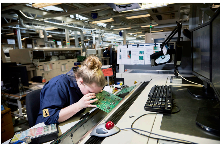
Elever kan få SPS-støtte til både psykiske funktionsnedsættelser eller til fysiske funktionsnedsættelser

Der er ikke en "one size fits all". Det er vigtigt, at den enkelte lærling får den støtte og vejledning, der er behov for. Det er den enkelte erhvervsskole, der er ansvarlig for at søge støtten hos Børne- og Undervisningsministeriet under samtykke fra lærlingen. Støtten kan bl.a. være i form af støttetimer, som virksomheden fakturerer til skolen. Det første skridt til at søge SPS-støtte er derfor, at lærlingen henvender sig til erhvervsskolens SPS-ansvarlige eller studievejleder.